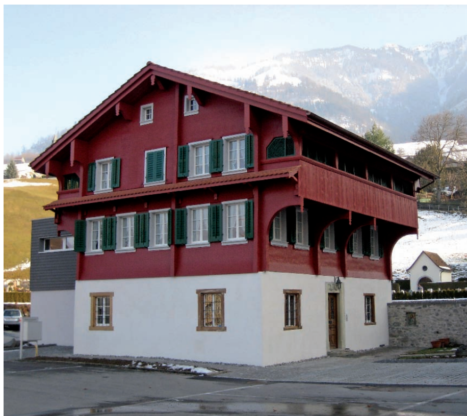
L'aumônerie du pèlerinage après sa rénovation et son élargissement.

Au début de l'année, l'aumônier et le secrétariat se sont installés dans les nouveaux locaux. La fondation «Frère Nicolas» dispose maintenant d'une infrastructure fonctionnelle pour les diverses tâches du pèlerinage. Tout près de l'église, les locaux sont facilement accessibles aux pèlerins.