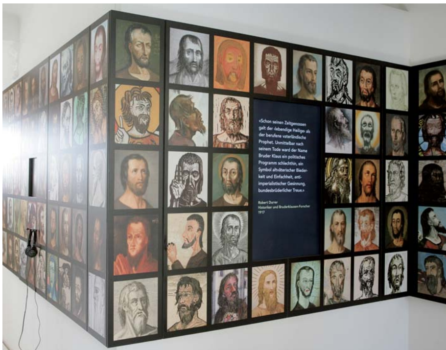
Une série de portraits de Frère Nicolas accueillent les visiteurs à l'entrée du musée.

Le Musée «Frère Nicolas» est une maison culturelle du canton d'Obwald est un lieu de rencontre pour tous. Elle est ouverte jusqu'à la Toussaint, du mardi au samedi de 10.00 à 12.00 heures et de 13.30 à 17.00 heures et le dimanche ainsi qu'à la fête de Nicolas de Flue de 11.00 à 17.00 heures. Pour informations voir à: www.museumbruderklaus.ch