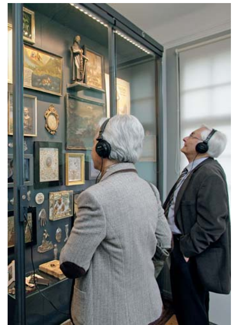
La nouvelle exposition peut être vue et écoutée.

Une exposition fut créée, faisant rayonner le portrait du patron de la Suisse jusqu'en notre temps. La figure de Nicolas de Flue interpelle le visiteur: son engagement pour la justice et le dialogue, son renoncement aux biens matériels et aux honneurs, son action en tant que conseiller municipal et instrument de paix. Ce sont des points de référence au service de la communauté et une orientation vers