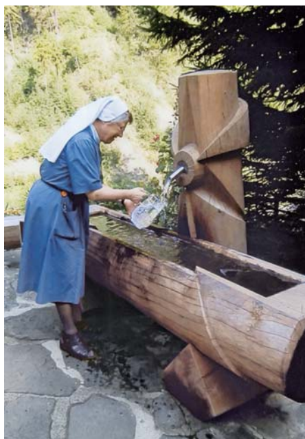
La nouvelle fontaine invite les pèlerins à s'y abreuver.

Une nouvelle fontaine près de la maison du Ranft a pu être inaugurée pour la saison des pèlerinages. Elle