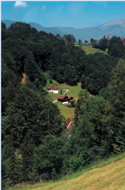
Au Ranft, l'ermite Frère Nicolas trouvait dans sa rencontre avec Dieu la force des profondeurs.