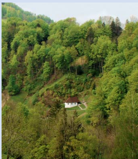
Le Ranft avec la chapelle supérieure

En 2017 nous commémorerons le 600 ème anniversaire de la naissance de Nicolas de Flüe. Nicolas de Flüe est un acteur privilégié de l'histoire et de l'identité d'Obwald. Nous sommes fiers de « notre » ermite du Ranft, une des personnalités les plus influentes de la Suisse.