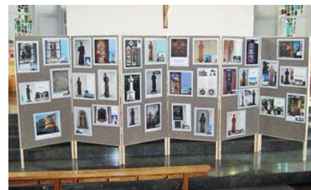
Exposition de posters